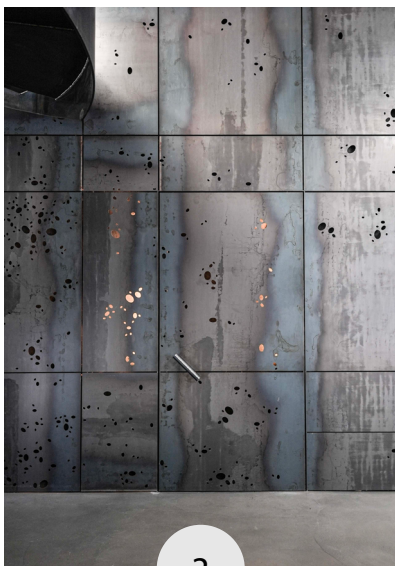
Porte ouverte positionnée