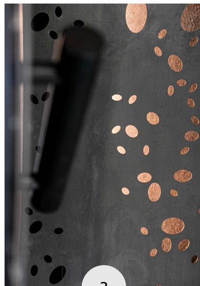
Porta chiusa posizionata